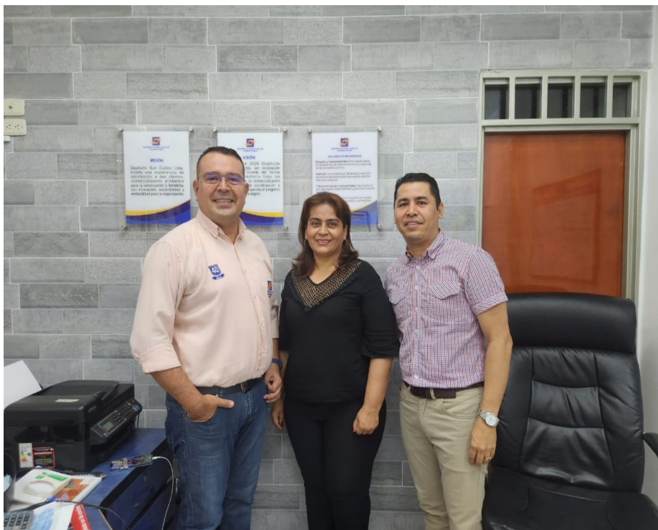
Muestra fotográfica “Depósito San Carlos Ltda.”

El 14 de Marzo de 2023, se llevó a cabo la visita a diferentes empresas del municipio del Espinal, tratando temas relacionados con apoyo en innovación generada en la gestión empresarial.