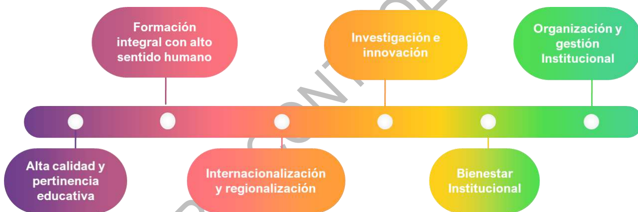
Figura 5. Premisas fundamentales sobre las cuales se sustenta el Direccionamiento Estratégico.

Para el logro de la misión y la visión, la Institución Universitaria ITFIP, cuenta con el Plan de Desarrollo Institucional 2019 – 2024, el cual se concreta como el instrumento fundamental para tal fin, del mismo se emana el Plan Estratégico 2019 - 2024, los cuales generan los lineamientos que permitirán el logro de las metas propuestas, de donde surgen las bases para la política institucional de acuerdo con cada área; siendo así como la propuesta de valor de la Institución se fundamenta en las siguientes premisas :