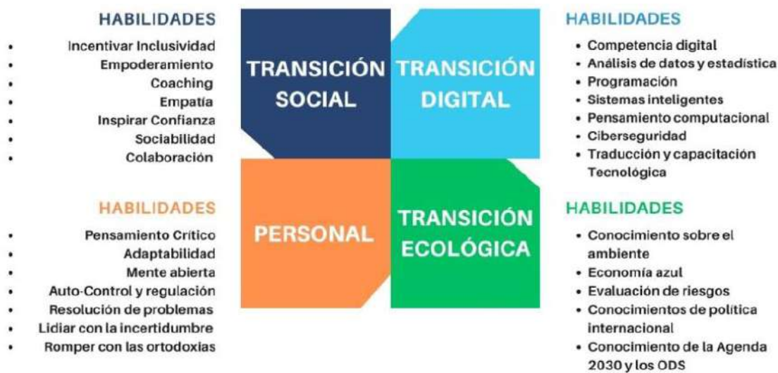
Figura 7. Habilidades para el futuro. (Tomado de Unesco, 2023).

Al tenor de estas habilidades, es claro que el ritmo hiperveloz sin precedentes, que genera cambios rápidos y constantes avances tecnológicos, los problemas sociales estructurales subyacentes a esta realidad aunada a la urgencia de mitigar y adaptarse al cambio climático permean el diario vivir de las personas, no siendo la excepción la educación y el trabajo. Así las cosas, de acuerdo con el informe de las Tendencias Mundiales de Empleo Juvenil (OIT, 2022), se estima que aproximadamente 1.600 millones de estudiantes se vieron afectados por la emergencia sanitaria por COVID – 19 y esta interrupción en el aprendizaje generó disminución significativa de competencias básicas de lecto-escritura y cálculo, lo que ha generado peligro en el acceso a la educación terciaria y con ello la vinculación a mercados de trabajo.