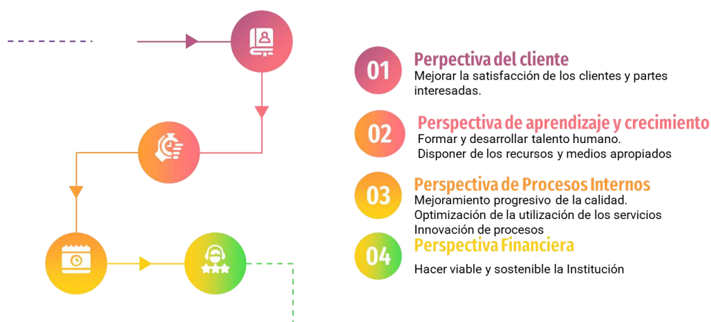
Figura 6. Objetivos y Perspectivas del direccionamiento estratégico de la Institución Universitaria ITFIP.