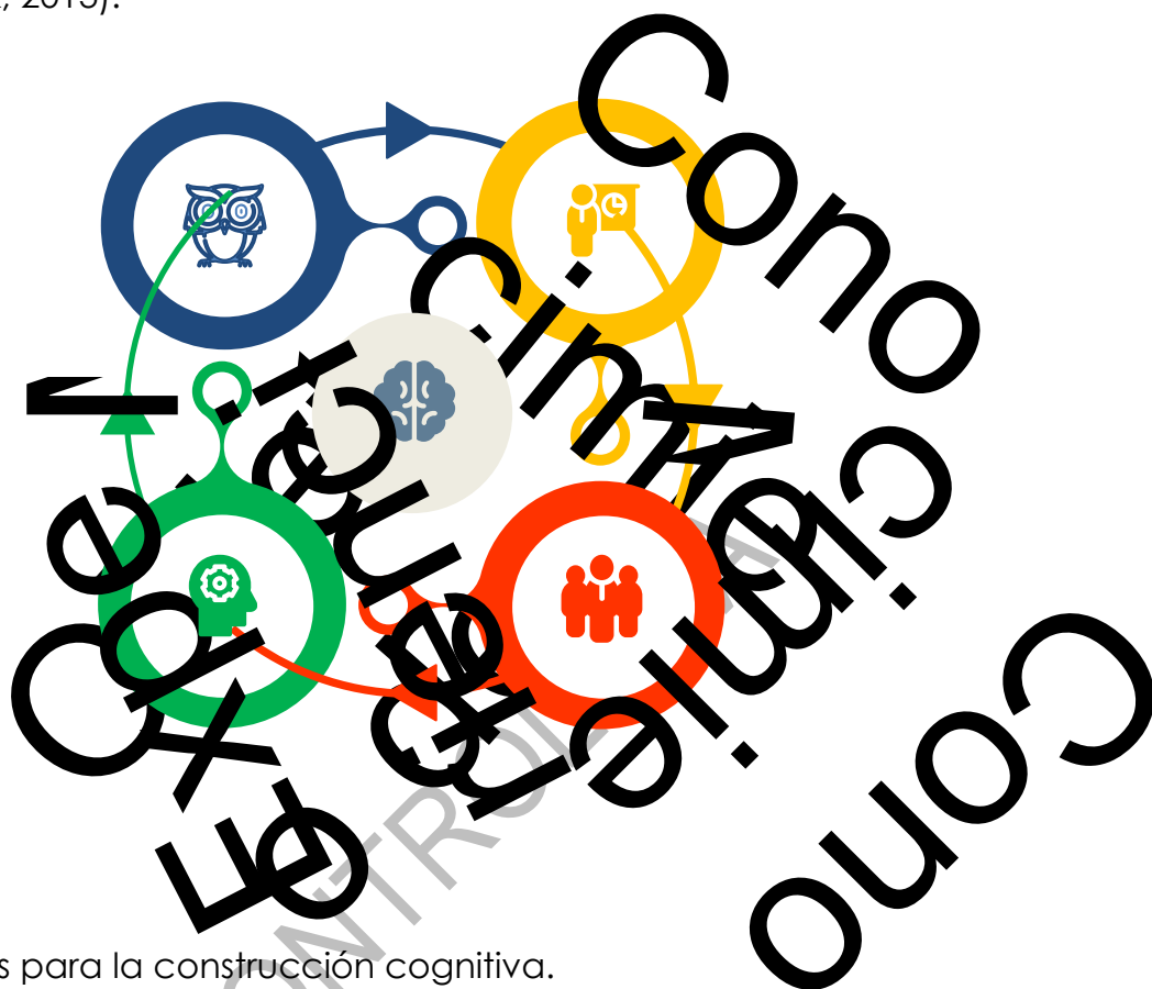
Figura 4. Interacciones para la construcción cognitiva.

incorporarle nuevos elementos va enriqueciendo su estructura cognitiva (Zimmerman y Schunk, 2013).