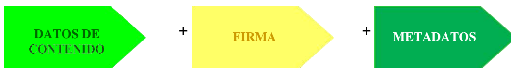
Figura 2. Estructura lógica del documento electrónico