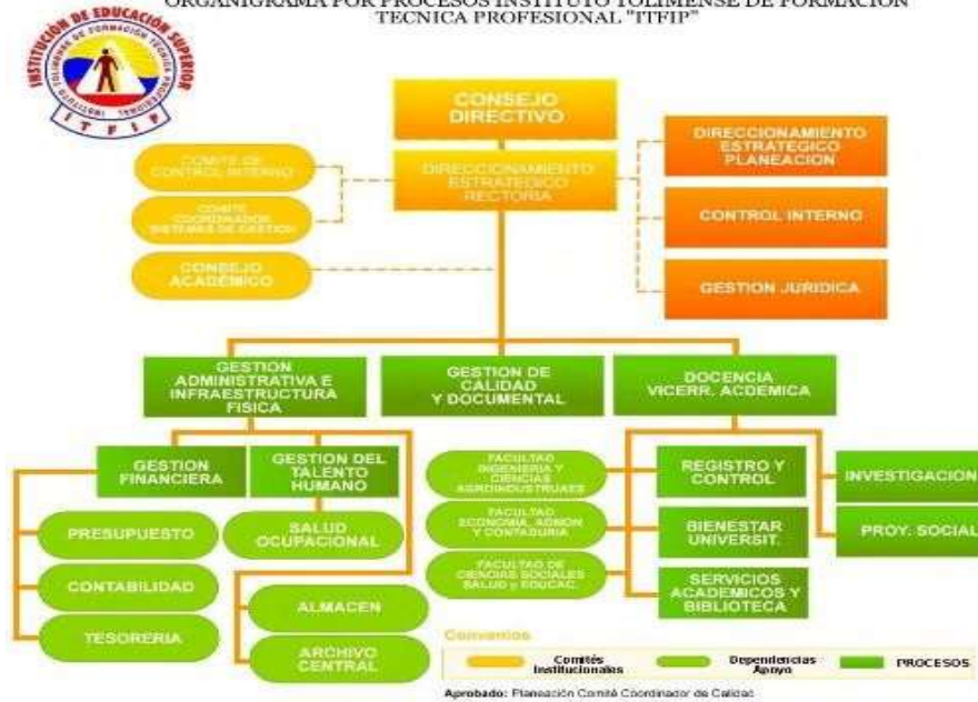
“ITFIP” INSTITUCIÓN DE EDUCACIÓN SUPERIOR ESTRUCTURA ORGANIZACIONAL POR PROCESOS Resolución 230 del 7 de Julio de 2008